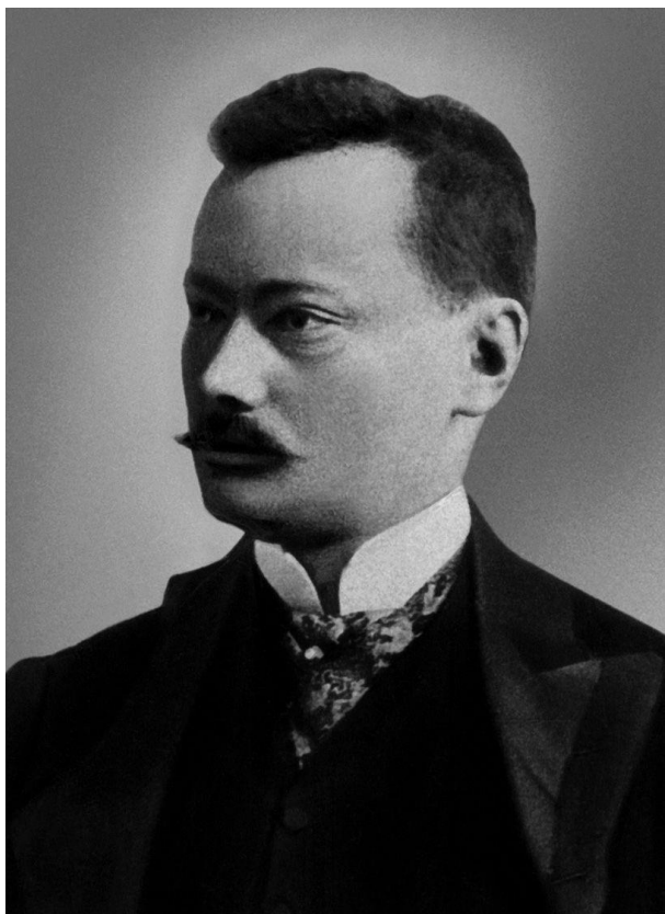
Báró Korányi Sándor, a magyar belgyógyászat megalapozója