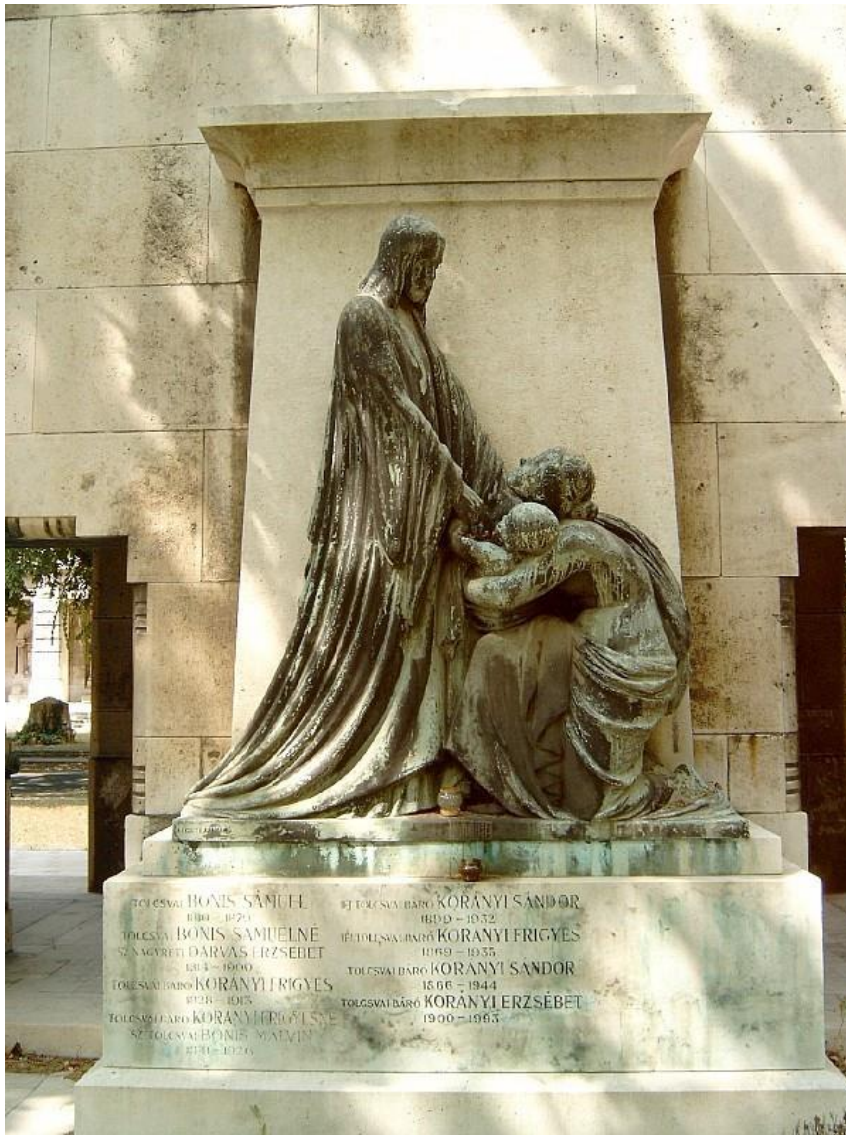
A Korányi család síremléke a budapesti Kerepesi temetőben