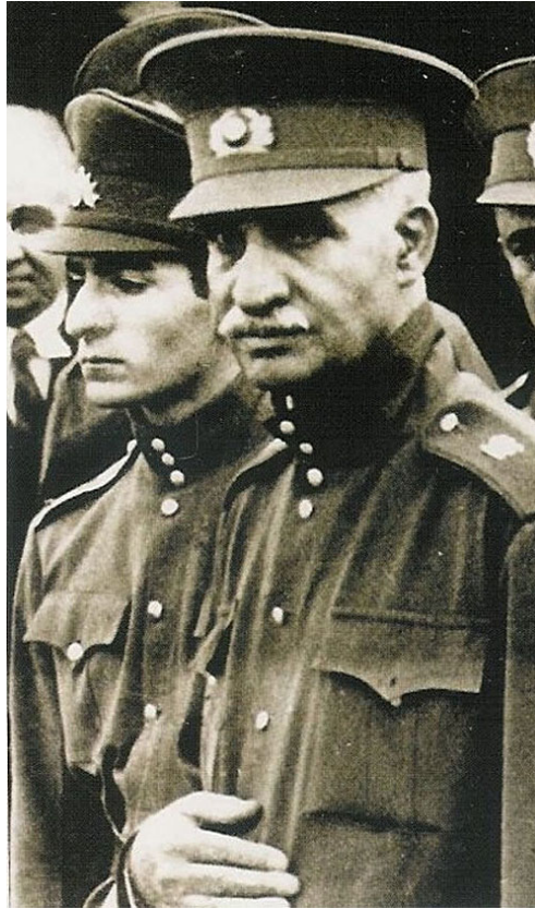
Reza sah uralkodóként is katonás, egyszerű életet élt