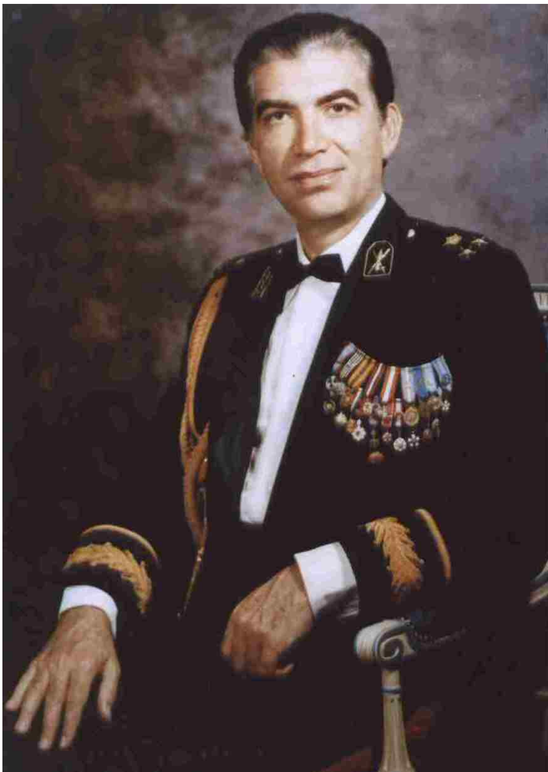
A dinasztiaalapító sah hét fia közül ma már csak Golám Reza Pahlavi herceg (1923) él