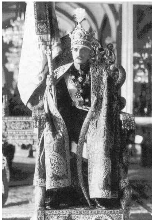
Reza sah a nép köréből emelkedett a pávatronra