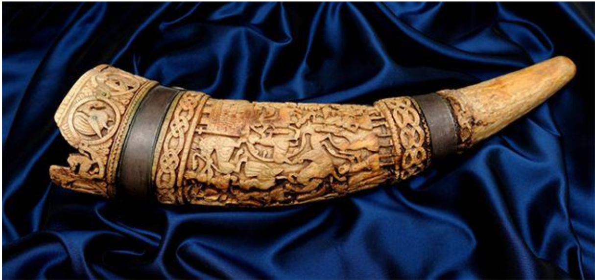
Lehel kürtje, a jászok féltve őrzött ereklyéje, melyet a jászberényi Jász Múzeumban őriznek