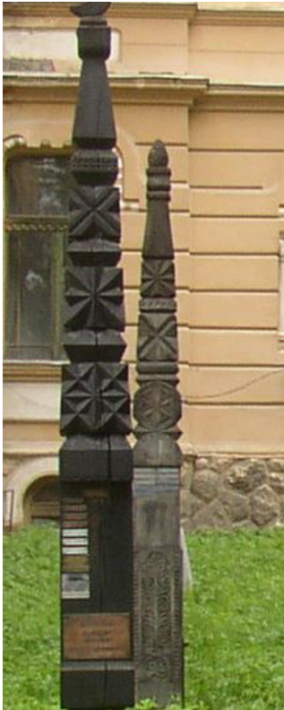
Kopjafa a csíkszeredai Márton Áron Gimnázium udvarán