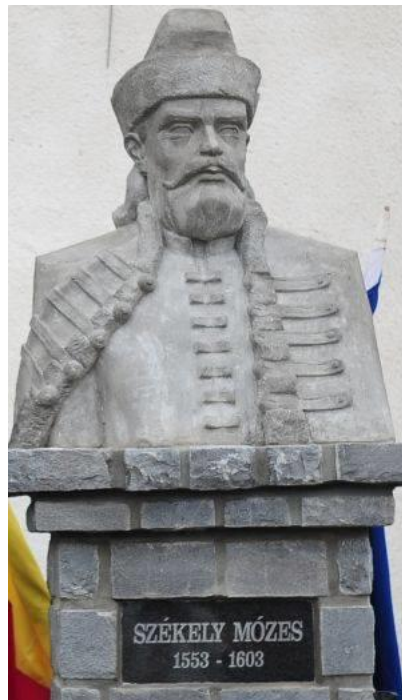
Székely Mózes (1553–1603), Erdély egyetlen székely származású fejedelme (Miholcsa József alkotása)