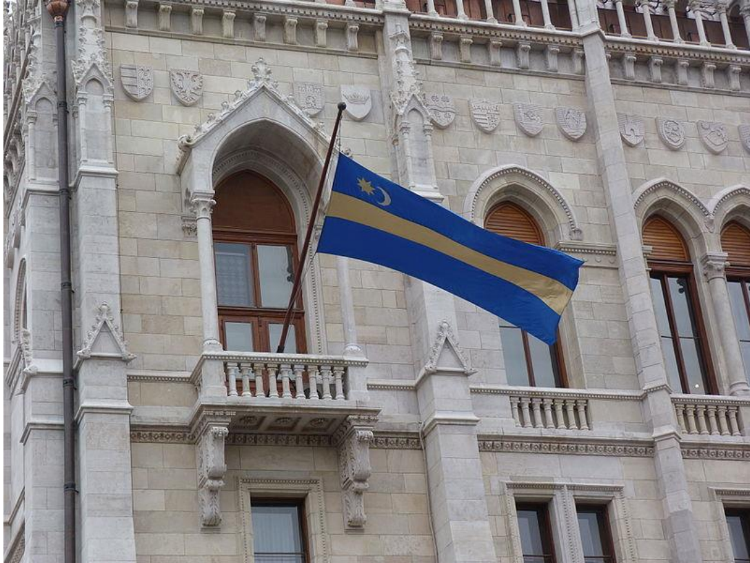
Székely lobogó a budapesti Országház egyik erkélyén