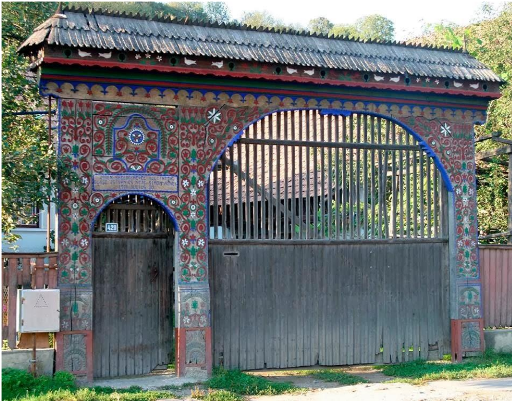
Egy máréfalvi porta gazdagon faragott és festett székelykapuja