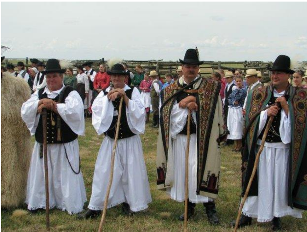
Férfiak jáász népviseletben