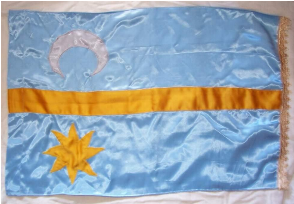
A székely zászló, a székely ősi szimbólumokkal, a Nappal (illetve a Nap stilizált változatával) és a Holddal lett díszítve