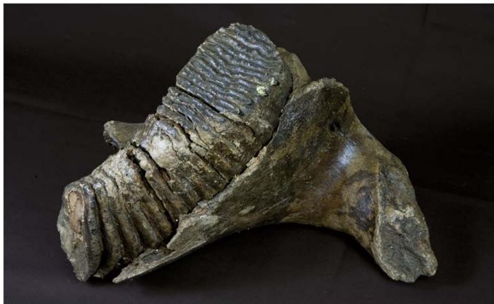
Fragment sánky mamuta srstnatého ( Mammuthus primigenius ) s molárom A gyapjas mamut ( Mammuthus primigenius ) állkapocstörredéke őrlőfoggal Fragment of the jaw of the Woolly Mammoth ( Mammuthus primigenius ) with a molar