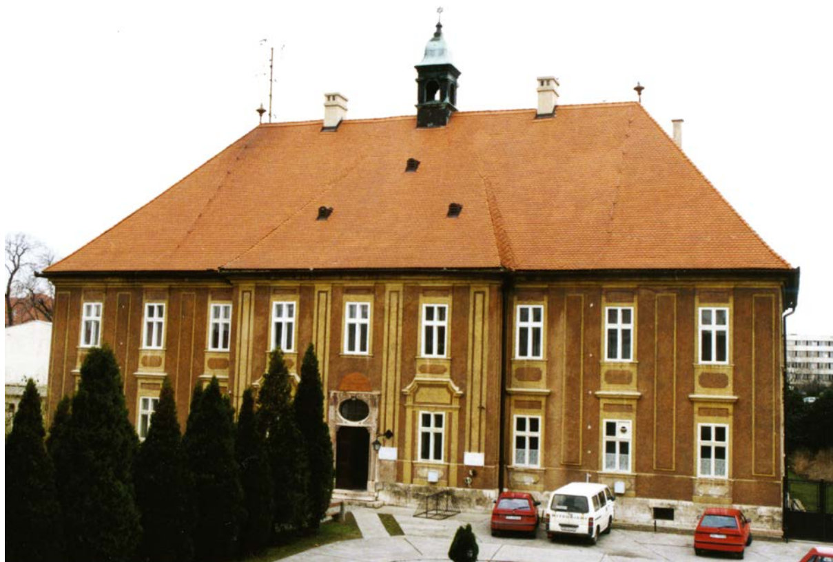
1. kép A komáromi Református Kollégium épülete