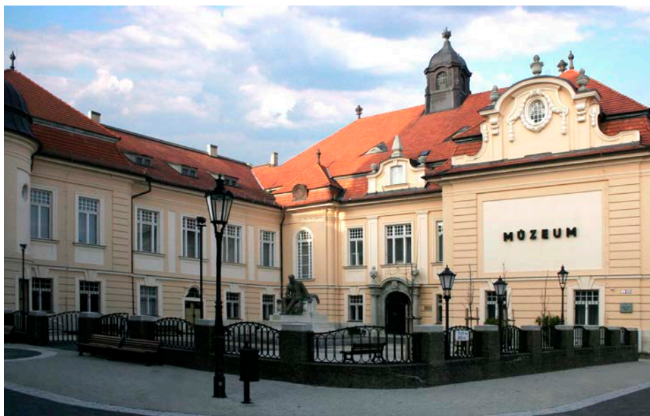
3. kép 1913-ban épült a Kultúrpalota, a múzeum főépülete