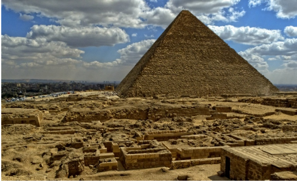
A Kheopsz piramis napjainkban