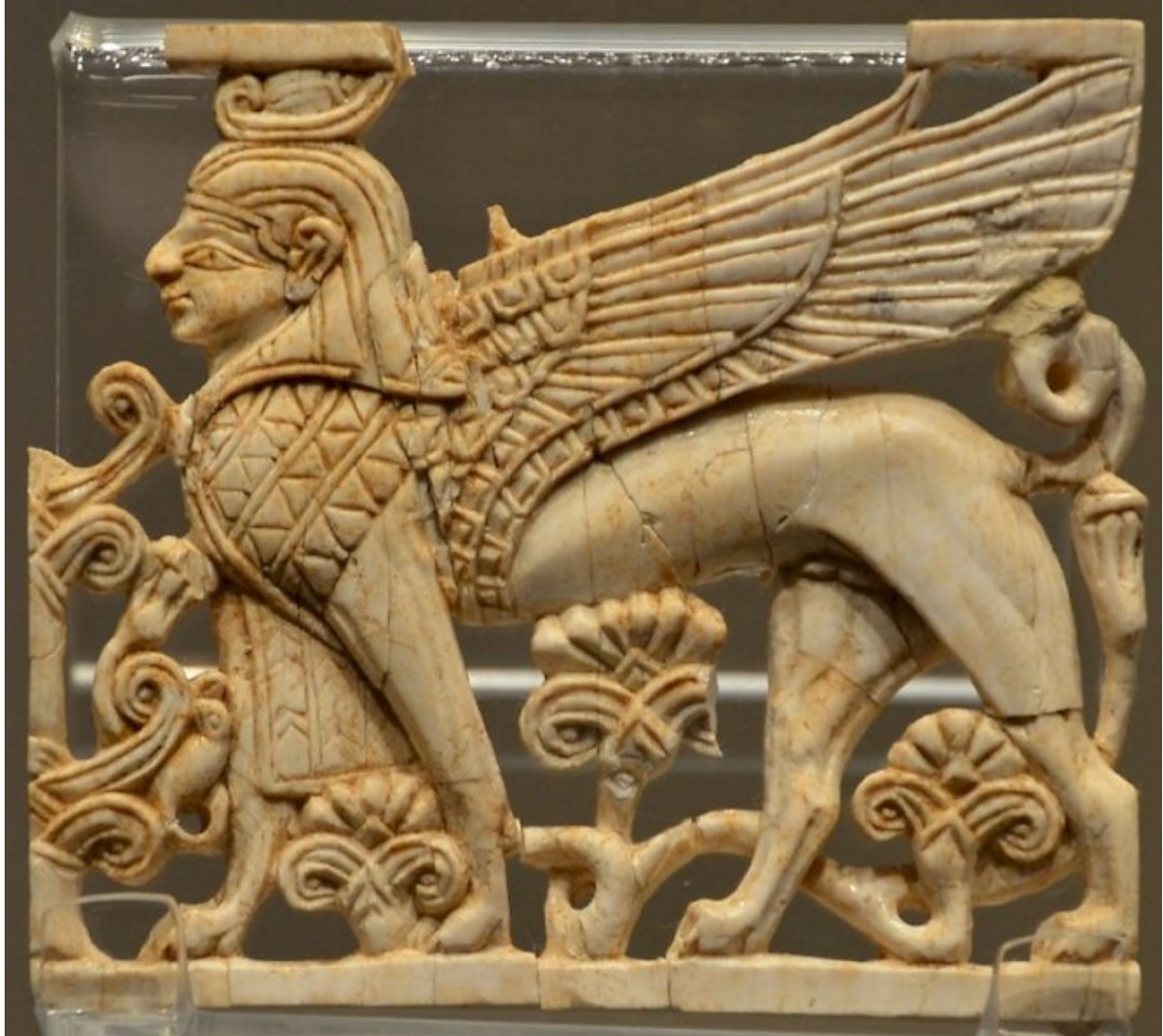
Elefántcsontból készült karthágói Szfinx