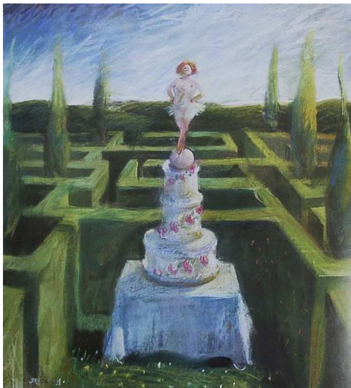
A győztes jutalma (1999. 120x110 cm, pasztell, rétegelt lemez, papír)