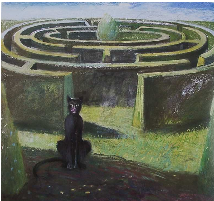
Labirintusban (1998. 110x120 cm, pasztell, rétegelt lemez+papír)