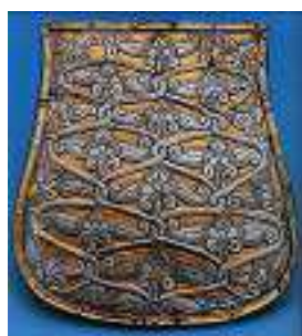
A GALGÓCZI TARSOLYLEMEZ MEGTALÁLTÁK: 1868-BAN