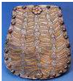
BODROGVÉCSI TARSOLYLEMEZ MEGTALÁLTÁK: 1897-BEN