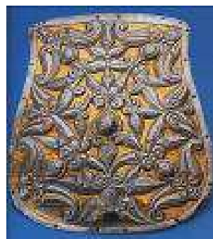
A SZOLNOK-STRÁZSAHALMI TARSOLYLEMEZ MEGTALÁLTÁK: 1912-BEN