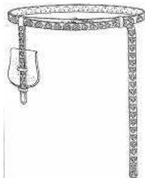
NAGYKÖRÖSI VERETES ÖV TARSOLLYAL