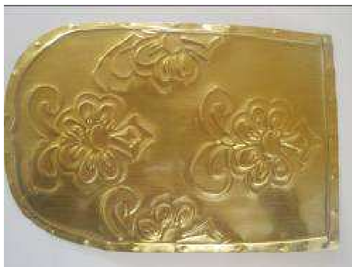
A NAGY MOTÍVUMOK ELHELYEZÉSE, KITÖLTJÜK A LEMEZFELÜLETET