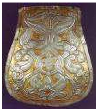
BÁRÁNDI TARSOLYLEMEZ MEGTALÁLTÁK: 1998-BAN