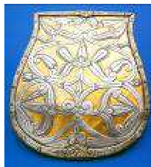
RAKAMAZI TARSOLYLEMEZ MEGTALÁLTÁK: 1974-BEN