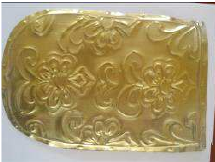
TOVÁBBI KISEBB DÍSZÍTŐ MINTÁK RAJZOLÁSA