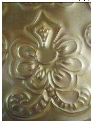
A MINTA KONTÚRJÁNAK DOMBORÍTÁSA