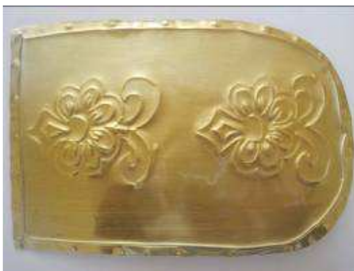
MINTARAJZOLÁS SABLONNAL, VAGY ANÉLKÜL