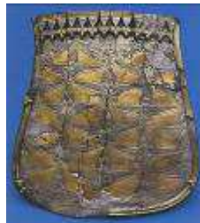
A SZOLYVAI TARSOLYLEMEZ MEGTALÁLTÁK: 1870-B