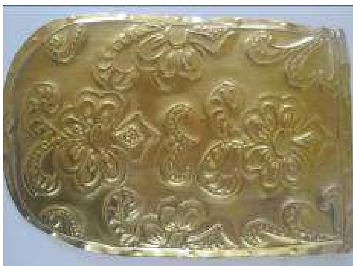
A MINTA FINOMÍTÁSA