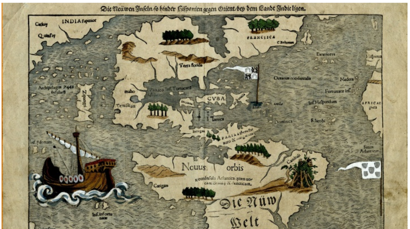
Sebastian Münster: Die Neüwen Inseln – Az új szigetek.

Az akkori embereknek 500 évvel ezelőtt olyan változásokat kellett átélniük, amelyek alapjaiban rengették meg a korábbi értékrendet, világfelfogást. A földrajzilag, ismeret-tudásban kitáguló világban nem volt könnyű megtalálni egy határozott fogódzkodót. A felfedezések úgy befelé (az emberi test, újfajta vallási elképzelések), mint kifelé (új kontinensek, növények, állatok, égitestek) tágították a világot, és egyaránt rávetültek a korszak embereire. Mivel a psziché és a környezet is megmozgott látszott a hatalmassá táguló világ által, ez végül oda vezetett, hogy megállapításra került: homo bulla est – az ember egy buborék, vagyis a nagy végtelenben egy kis, bár gyönyörűen fénylő, színekben pompázó, de mégiscsak rövid ideig fennálló, könnyen szétpukkanó gömb.