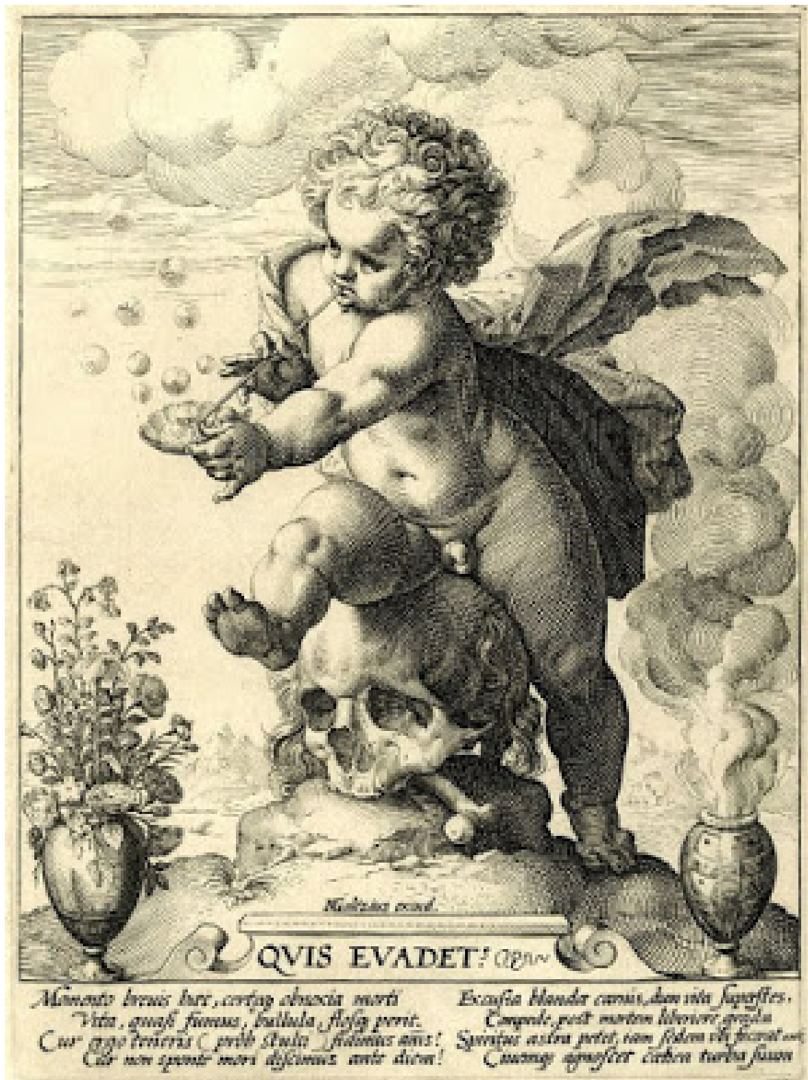
Hendrik Goltzius: Homo Bulla, 1594